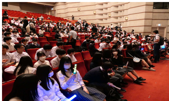
学園祭（白根祭）1日目 白根桃源文化ホール 保護者も参観